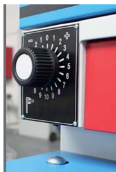
ODMĚŘOVÁNÍ VÝŠKY OBROBKU - POZICIONER STOLU